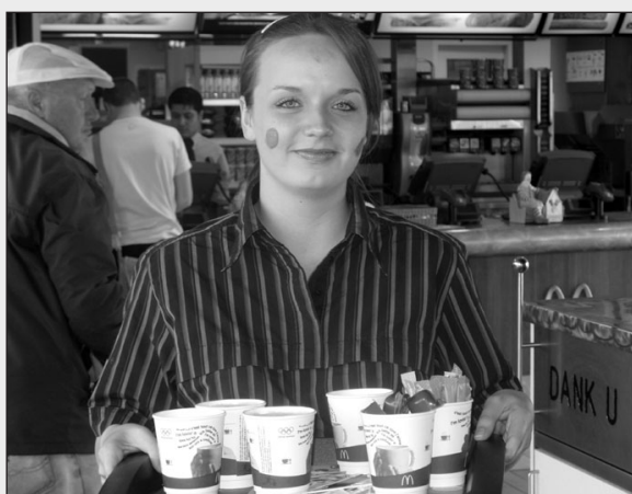
Dagelijks bij McDonald's verse, duurzame koffie.

"De overstap op deze duurzame koffie past in het streven van McDonald's om duurzaam te ondernemen en kwaliteit van haar producten voortdurend te verbeteren".