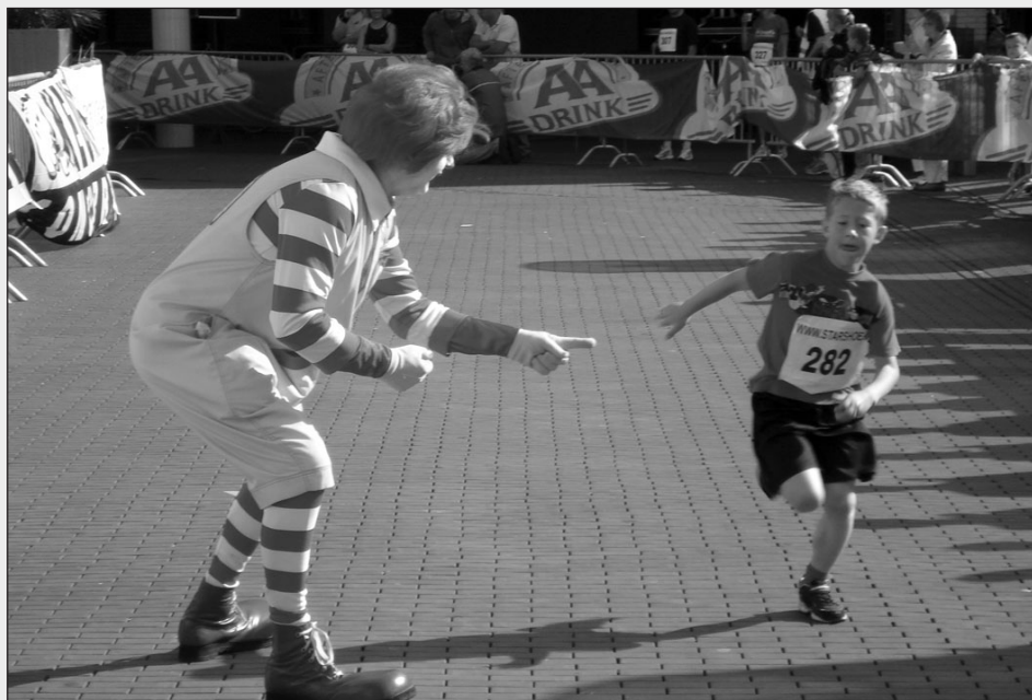
Ronald McDonald moedigde de deelnemer aan