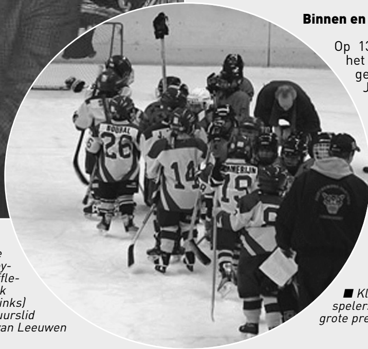
■ Kleine spelers maar grote prestaties

Jeugdteams uit binnen- en buitenland strijden dan in het SilverDome om de toernooizege en de Fair Play cup.