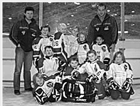
■ Enige talenten van de Zoetermeer Panthers

"Ijshockeyvereniging Zoetermeer Panthers organiseert jaarlijks een